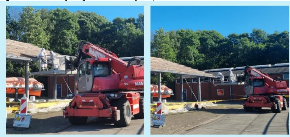
Figuur 3. Asbestverwijdering zonder schuim tijdens pilot

Het werken met adembescherming met luchtfilters en een asbestpak (werkkleding) brengt beperkingen met zich mee tijdens de uitvoering van de werkzaamheden en de productieve uren. Saneerders mogen maximaal 2 uur onafgebroken werken in een pak, waarna ze moeten douchen, zich omkleden en een uur pauze moeten nemen. Dit resulteert in een werkdag van 8 uur, waarin 6 uur wordt besteed aan het verwijderen van asbesthoudend materiaal.