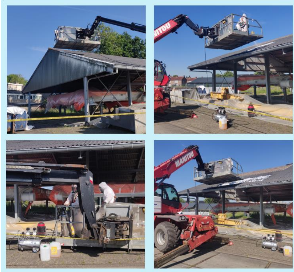
Figuur 4. Asbestverwijdering met schuim tijdens pilot